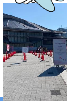
③11時過ぎには 開場待ちの列が既に でき始めていました