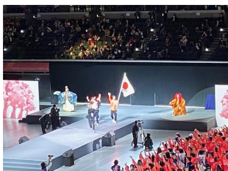
⑦各国の旗手がランウェイを歩く両側には 手話歌舞伎・手話狂言の二人が様々なポ ーズを演じ続けて、日本の文化を演出