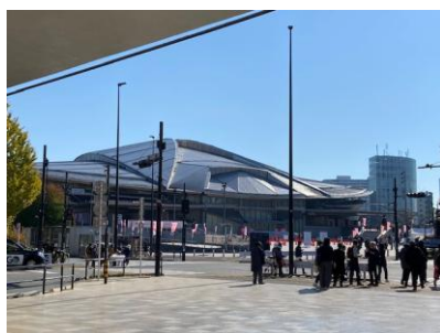
①午前中から千駄ヶ谷の駅前は賑わい

今大会では共生社会に向 けた意識改革も随所に見受 けられました。大会はこれに て閉幕となりましたが、課題 も含め、共生の未来へ向け た新たなスタートですね！