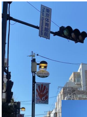
②信号を渡って 会場へ進むと