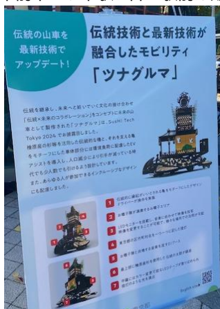
⑥日本の伝統と未来を 繋いでいました