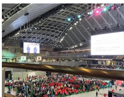
⑧会場内は国際手話と日本語、 文字情報(スクリーン及び電光掲示板) にて情報保障がされていました