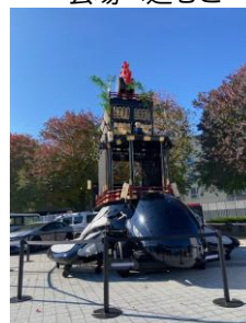
⑤エントランス前には ツナグルマが