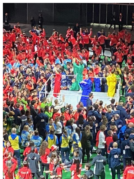
⑨フランス語の BON「良い」と日本の盆踊り の「盆」を掛け合わせた演出、『BON 未来』を、 100年の歴史と未来への希望を込めて 各国選手たちと楽しんで幕を閉じました